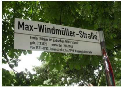
Max Windmüller Strasse in Emden