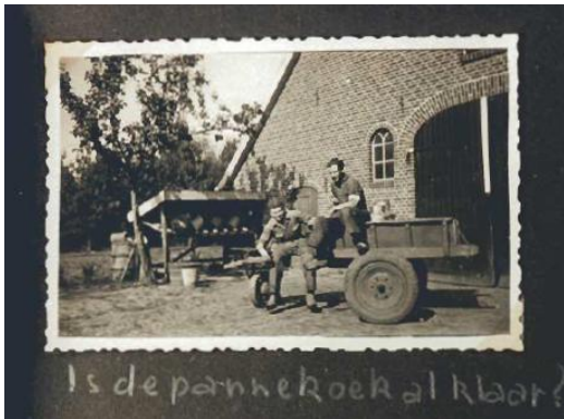
Is de pannekoek al klaar? Is de pannekoek al klaar?